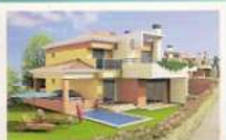
➤ Morada Cond. privado Oitões d'Água - Algarve - 375.000 Euros Pág. 32