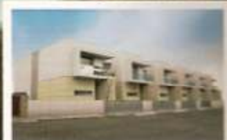
➤ Moradas T4 Nogueiró - Braga Pág. 31