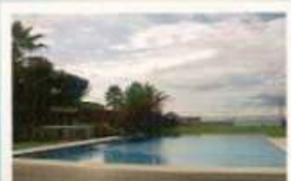
➤ Apart. 1ª Linha de Mar Estoril - Cascais - 850.000 Euros Pág. 30