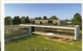
➤ Moradas de Luxo ao Porto Condomínio privado - Matosinhos Pág. 39