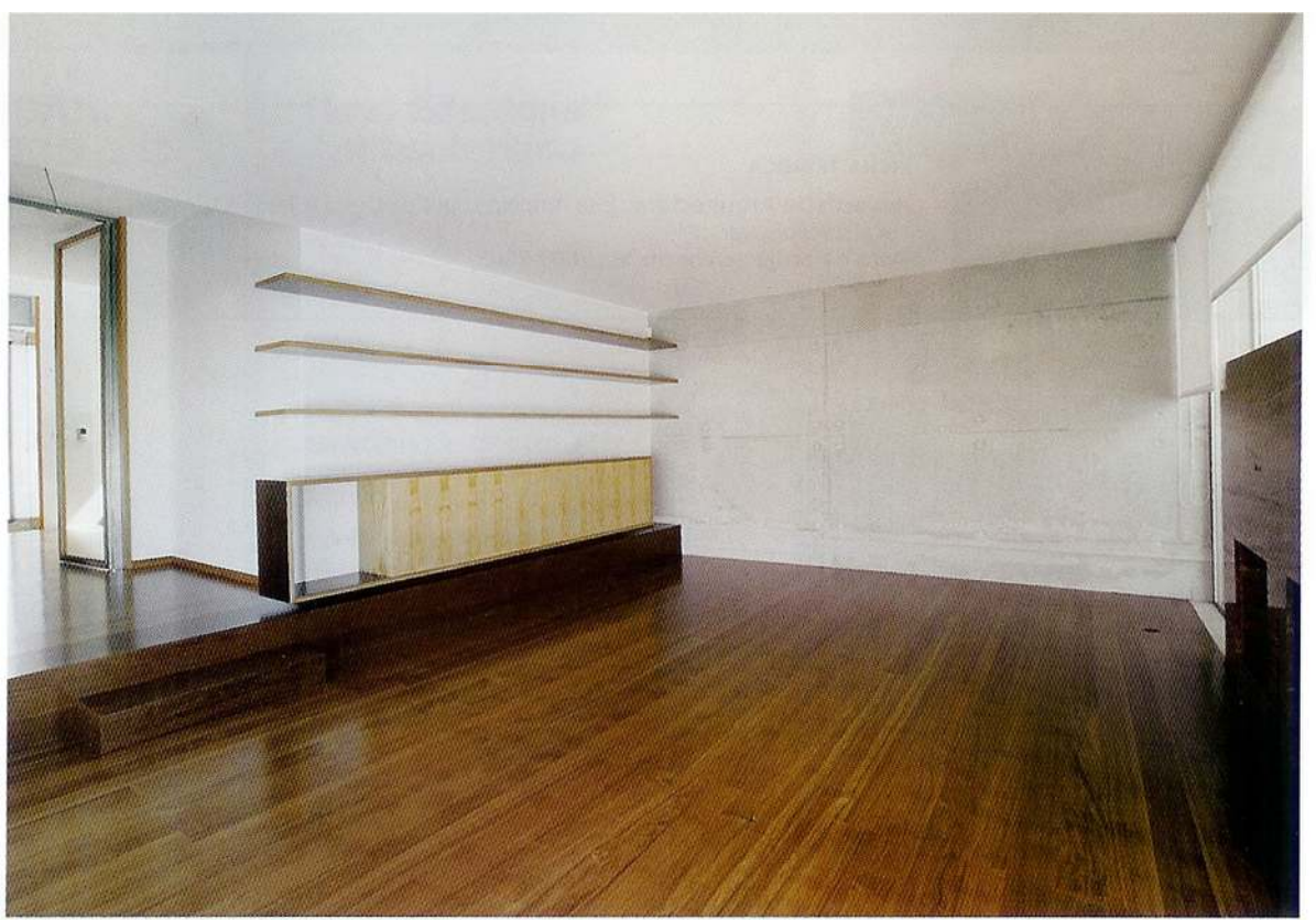
→ Na sala de estar, desenvolvida a dois níveis ligeiramente diferenciados, procurou-se a articulação com o terreno exterior, voltado a Sul/Poente